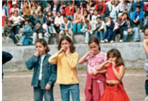
Cuatro alumnas silbando

En la medida que el alumnado consiga desarrollar estas actitudes hacia el lenguaje silbado, estaremos consiguiendo que aprenda a respetar las culturas autóctonas no como fenómenos folclóricos, sino como elementos indispensables de una verdadera cultura universal, integradora de todas las culturas existentes en nuestro país, así como en Europa y el resto del mundo.