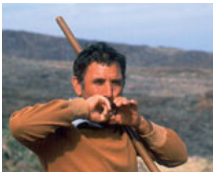
Pastor gomero silbando

Hay pues dos «vocales silbadas», que, como hemos dicho, no son verdaderas vocales, sino representaciones simplificadas. La aguda, que podría señalarse, convencionalmente, como <I>, puede ser tanto [i] como [e]; la grave, que podría marcarse como <A>, servirá como representación de las vocales [a], [o], [u]. Ya vimos más arriba que la diferencia entre el masculino y el femenino, encomendada por lo general a las vocales [o] y [a], respectivamente, se resolvía a menudo con la anteposición de las formas masculina y femenina del artículo, ascendente la primera y descendente la segunda.