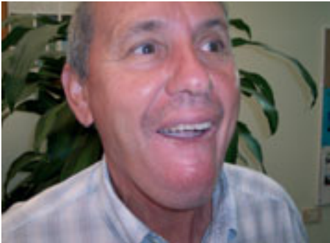
3. Posición de la lengua para emitir sonido