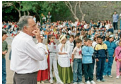
El maestro de silbo ante su alumnado

El nivel de comprensión del lenguaje silbado exigible debería limitarse en los primeros niveles al de sencillos mensajes que sirvan para comunicar acciones, acontecimientos, etc., de la vida cotidiana y de las experiencias propias dependiendo de la edad. Así, por ejemplo, sería deseable que en un primer momento el alumnado fuera capaz de comprender su nombre y el de sus amigos y familiares más allegados; frases cortas relacionadas con acciones cotidianas: la comida, el aseo, el colegio, la familia, etc., para progresivamente ir comprendiendo mensajes más complejos.