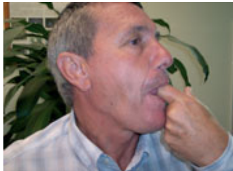
8. Posición del dedo con relación a la lengua doblada