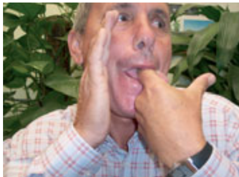
10. Silbador emitiendo mensaje