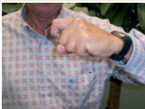
2. Posición del dedo para silbar