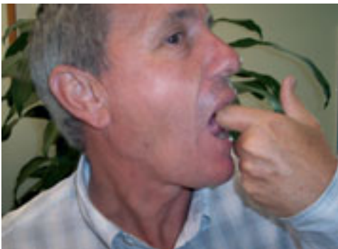
7. Otra posición de la lengua para emitir sonido