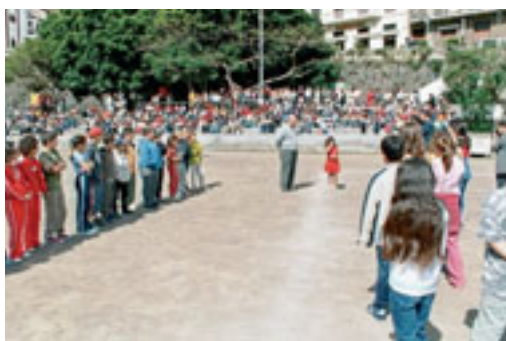
Otro momento del encuentro

Uno de los componentes más importantes de la cultura de un pueblo es su lenguaje y los medios que utiliza para transmitirlo a los demás. Desde ese punto de vista, el lenguaje silbado de La Gomera es un fenómeno cultural de primera magnitud, porque representa uno de los pocos elementos realmente autóctonos no sólo de la isla de La Gomera sino