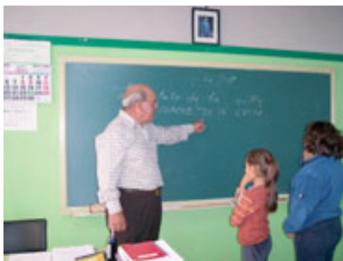
Clase de silbo