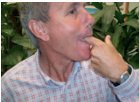
9. Vista lateral de la posición del dedo, lengua y labios emitiendo mensaje