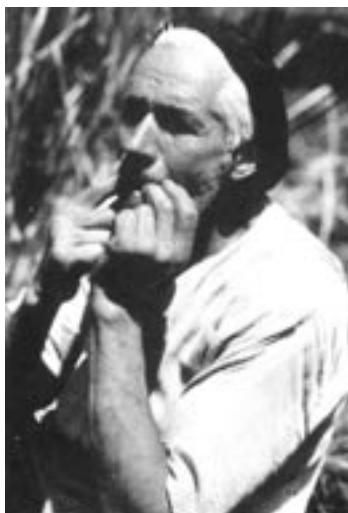
Agricultor gomero silbando