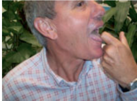
4. Vista de la posición del dedo en contacto con la lengua