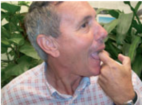
5. Posición del dedo con relación a la lengua