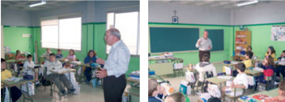
Otros momentos de la clase de silbo