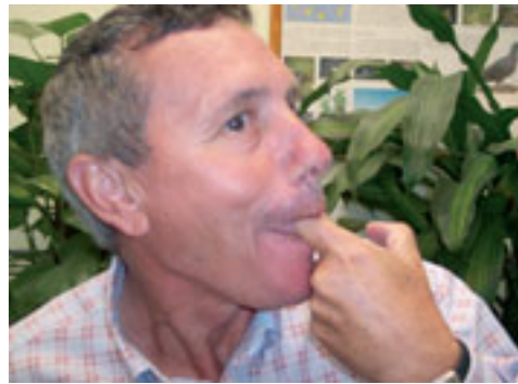
6. Vista lateral de la posición del dedo, lengua y labios para poder emitir sonido