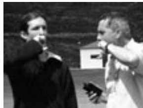
Aprendiendo a silbar